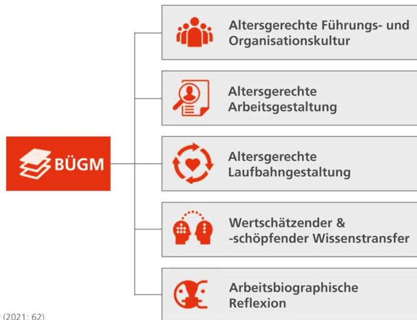
Abbildung: Handlungsebenen des BÜGM-Ansatzes

Hinweis: Von einer Förderung ausgeschlossen sind Betriebe, die bereits im Rahmen des BGF-Projektcalls 2023 unterstützt werden. Bei der Ermittlung von betriebspezifischen Ressourcen- und Belastungsfaktoren muss jeder Betrieb zu Beginn und gegen Ende des Projekts eine quantitative Bedarfs- und Wirkungsanalyse vornehmen. Bei der Erst- und Zweitbefragung verpflichtend zu verwenden ist das validierte Erhebungsinstrument „Altersfreundlichkeit am Arbeitsplatz“ (ALFA), inkl. soziodemografische Variablen und selbstgenerierte Personencodes. Auf Anfrage kann eine Ansichtsversion zur Verfügung gestellt werden. Es wird empfohlen diesen Fragebogen mit einem etablierten BGF-Erhebungsinstrument zu kombinieren (z.B. KombiAG).